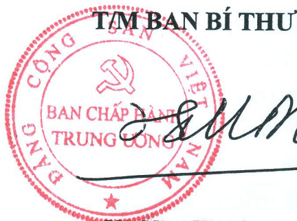
Võ Văn Thường